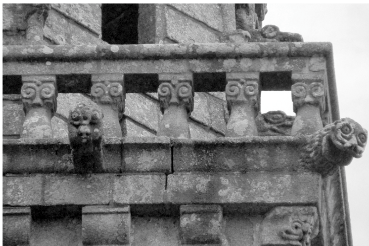
Fig 3 : Seconde plate-forme avec balustrade à colonnettes et ses gargouilles

Cette flèche hexagonale, posée sur cette plateforme, mesure 36 mètres de haut et surmontée d'une croix de 2 mètres ; elle comporte sur ses arêtes vives 38 crochets espacés de 65 centimètres.