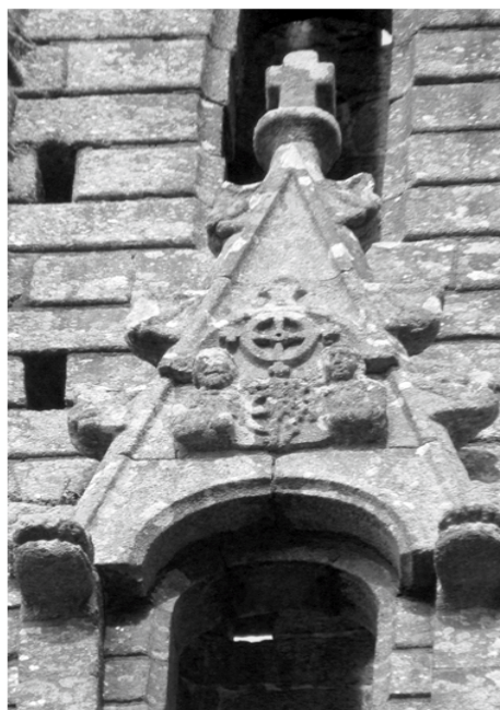
Fig 4 : Baie intérieure de la flèche surmontée d'un galbe à crochets et armorié

Chaque face est ajourée de 8 baies, de taille décroissante, à plein cintre ou rectangulaire ou losange, certaines surmontées de gable à fleurons et crochets portant des têtes grotesques, écus ou petits personnages tirant la langue ou grimaçant. C'est ce que l'on appelle : un clocher à jour 7 . En effet, ces ouvertures permettent au vent de traverser et ainsi de diminuer la pression exercée sur les faces exposées et d'éviter un effondrement.