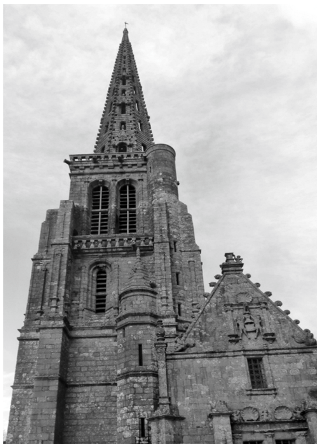
Fig 5 : Tour et secrétairerie (sacristie)

Le 15 octobre 1987, une violente tempête souffla sur la Bretagne. La flèche résista aux bourrasques. Cependant, le maire de l'époque, Henri Lachiver, s'aperçut que la pointe s'était déplacée dans un double mouvement, latéral et de rotation. Il fit prendre les dispositions nécessaires pour pré-