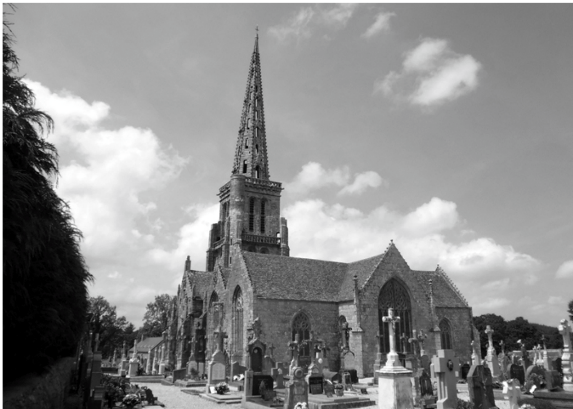
Fig 6 : Ensemble de l'église de Bulat