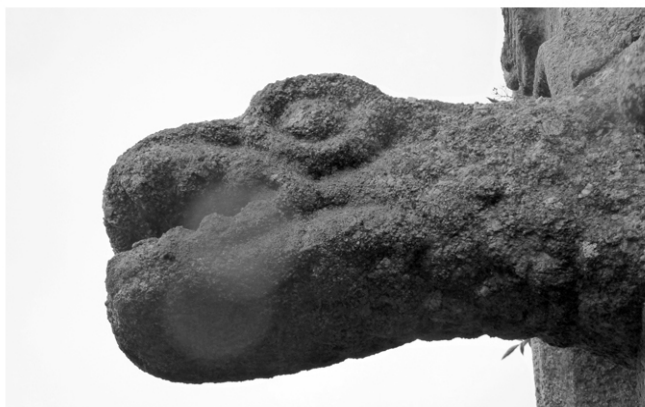
Fig. 1 : Tête d'animal monstrueux à la base de la flèche

Flanquée de huit contreforts et décorée de pilastres et de niches couvertes de délicieuses sculptures, elle est distribuée en trois étages par des entablements, des frises, des corniches et des galeries. Les deux étages supérieurs sont percés de quinze fenêtres, de cinq mètres de hauteur, sur soixante-six centimètres de largeur. Leurs parois extérieures sont couvertes d'élégantes moulures, et leur clef de voûte simule des consoles chargées de sculpture. Ces fenêtres sont flanquées de chambranles élancées et couvertes de losanges, de macles et de toutes sortes d'ornements de la Renaissance, et se termine par un coquillage, en guise de fleurons. Une galerie, composée tour à tour d'arcades cintrées et de balustres couronnés de chapiteaux couverts de feuillages, règne au pourtour de la première plate-forme. Rien donc de plus simple que de mettre la seconde en conformité de style avec la première.