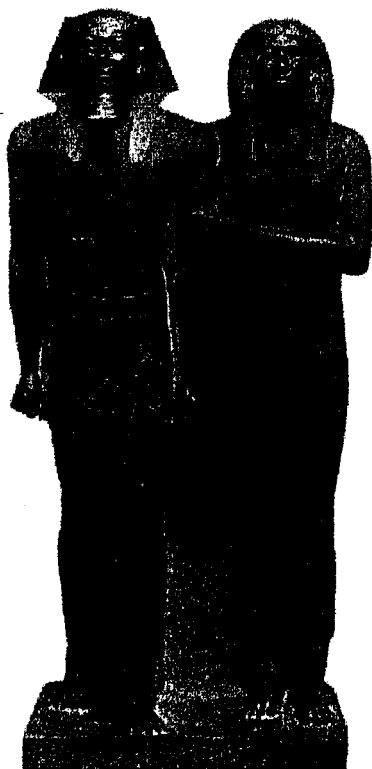
Mykerinos et Khamernerneby sa femme (2500 av JC)