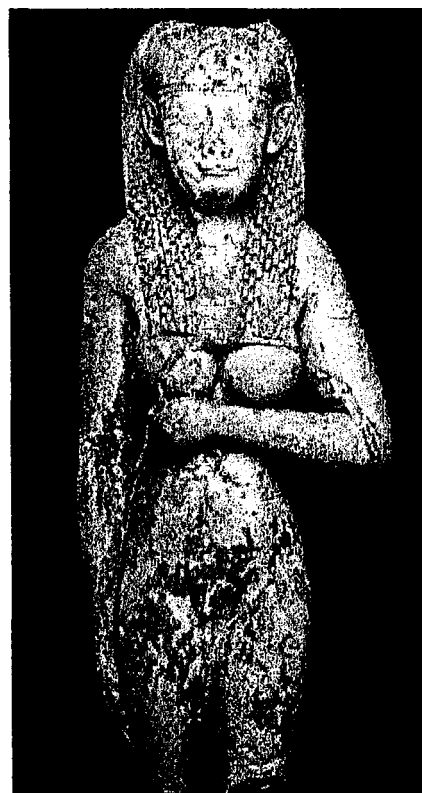
Reine inconnue du III e siècle av JC

Lorsque la civilisation grecque vient influencer l'art égyptien au point de créer un nouveau style, les statues sont encore plus dépouillées. De cette époque datent des statues d'Isis Aphrodite callipyges totalement nues (toujours avec les pieds joints) probablement plus impudiques que ne l'était la statue de Castennec. Si l'on admet que la statue de reine égyptienne du III e siècle avant JC est le plus proche modèle possible, il faut bien lui reconnaître des formes féminines très marquées, dont se départit totalement la statue de Quinipily actuelle ; celle-ci n'a vraiment rien qui soit susceptible d'entraîner un culte de caractère lubrique : c'était bien le but recherché par le clergé du XVII e siècle.