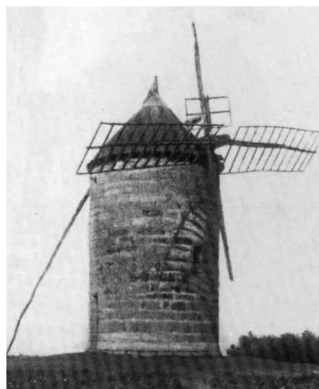
Le moulin avant-guerre