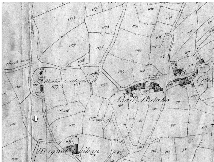
Carte du lieu du gibet (rectangle blanc)