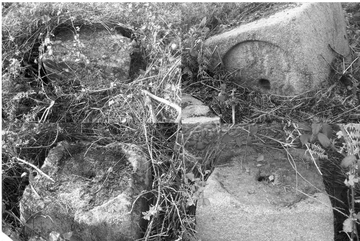
Les pots de justice (aux 4 coins du rectangle indiqué sur la carte)

Le gibet de Kerduel est constitué par une base de quatre pyramides tronquées identiques de granit local taillé à quatre faces trapézoïdale (50x90x75cm) avec un socle carré (75x75cm) posé sur le sol initialement.