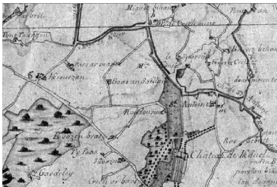
Le château de Kerduel en 1829, on notera le moulin à eau du Squivit en plus du moulin à vent de Crechmeur , l'ancien gibet (rectangle blanc) dans l'axe du château ainsi que la Chapelle seigneuriale de Saint-Antoine.

Recherches effectuées par Roger Le Doaré avec le concours de Marcel Le Guirinec de Pleumeur-Bodou en mars 2008.