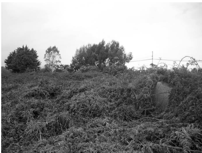
Le pot sud-est et la maison du meunier au fond (en 2008)

La face supérieure porte un disque en creux de 2 cm pour un diamètre de 50 cm et une mortaise centrale carrée de centrage peu profonde (5 cm) variant de 4 à 8 cm de côté selon les blocs. Sa faible profondeur ne permet pas l'enfoncement d'un mât mais plutôt d'un tenon à la base d'un poteau ou d'un tronc d'arbre qui remplirait la circonférence en creux. Ces poteaux étaient ensuite joints entre eux par des madriers pour former au moins quatre potences.