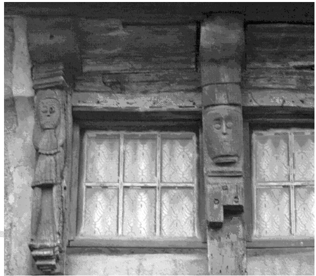
5b - Langonaval - pignon Nord : des motifs archaïques

résidentielle du bâtiment que nous venons d'évoquer fut modifiée afin d'assurer une autre fonction, commerciale celle-là. En effet le pignon nord de Langonaval fut transformé en façade d'une échoppe commerciale correspondant à l'époque où la rue de Kerampont devenait de plus en plus passante, conséquence du développement commercial de la ville de Lannion et de l'édification du pont de Sainte Anne. Il est certain que si nous établissons l'édification du pont entre les années 1373-1420, du fait qu'il a fallu que l'église du Porchou soit terminée et en particulier sa chapelle dite de Sainte-Anne, il aura fallu un temps de latence pour que le faubourg de Kerampont se développa. La marchandisation de ce secteur intervenant fin du siècle suivant puis début XVI e mais surtout après les guerres de La Ligue. Or les maisons à pan-de-bois à gaine de Lannion sont datées de la fin du dernier quart du XVI e 13 et la façade Nord de Langonaval, compte tenu de ses motifs archaïsants est antérieure, début XVI e .