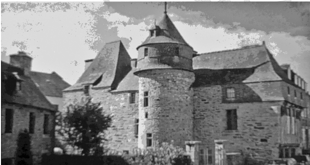
1 - Langonaval aujourd'hui

Cette observation architectonique du bâti est une partie d'une étude plus étendue que l'on trouvera à la bibliothèque de l'ARSSAT. Il n'existe aucune étude de ce bâtiment et les auteurs lannionais faisant état de leur ignorance, écrivait : « Langonaval, voilà un manoir à l'histoire mystérieuse » 1 . Nous pensons lever un coin du voile.