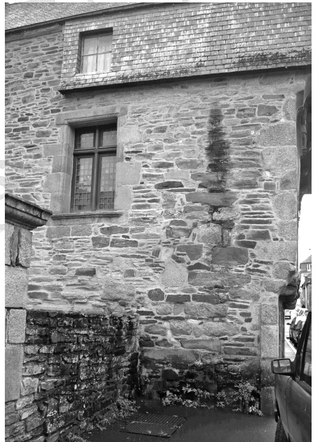
2 - Langonaval, modification du pignon Nord : dissemblance d'appareillage (Les piliers ont été apportés en 1975)

On peut constater aisément sur la face regardant le bas de la rue que la façade-pignon Nord à pan-de-bois est un collage secondaire au bâtiment primitif. Cette particularité n'était pas visible tant qu'il existait un crépissé de ciment recouvert de placards publicitaires qui en empêchaient la lecture. A l'heure actuelle le crépit s'est dégradé et l'on peut remarquer assez facilement la différence de l'appareillage. début XVI e