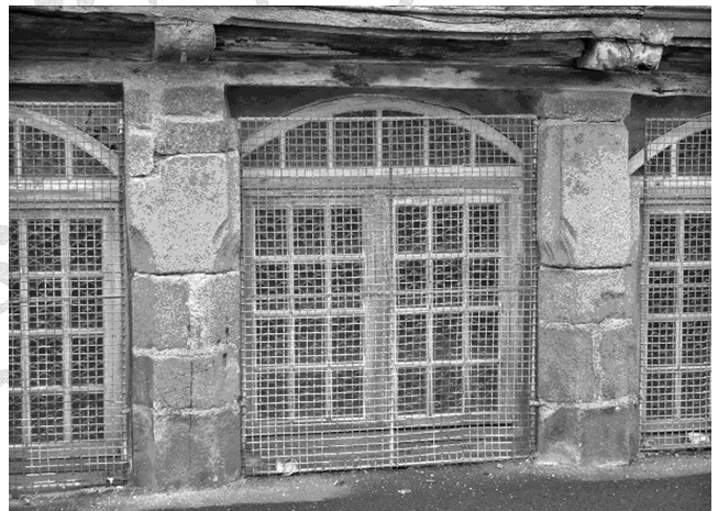
6 - Langonaval - pignon Nord : réutilisation d'éléments plus anciens

Une observation de la façade commerciale de Langonaval, donnant sur la rue, montre que les matériaux employés sont issus d'une autre échoppe provenant d'un autre lieu ce qui explique le décalage entre l'archaïsme de cette façade commerciale et son édification qui doit être sensiblement contemporaine de l'aménagement de la rue.