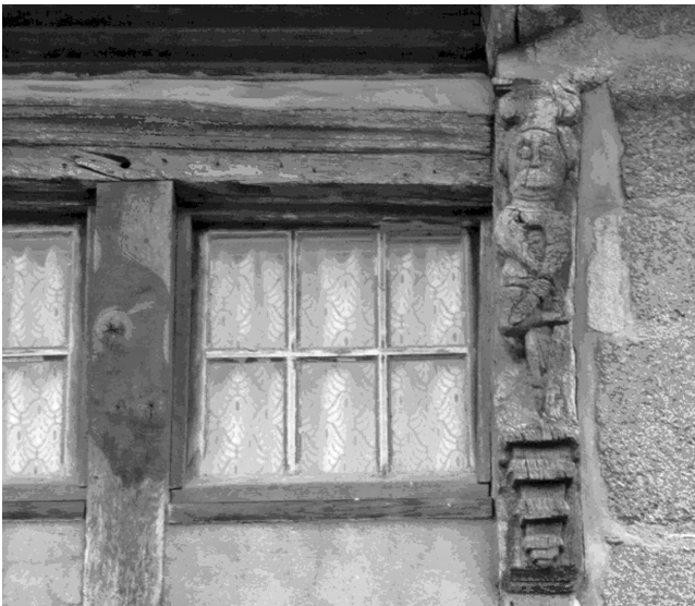
5a - Langonaval - pignon Nord : des motifs archaïques