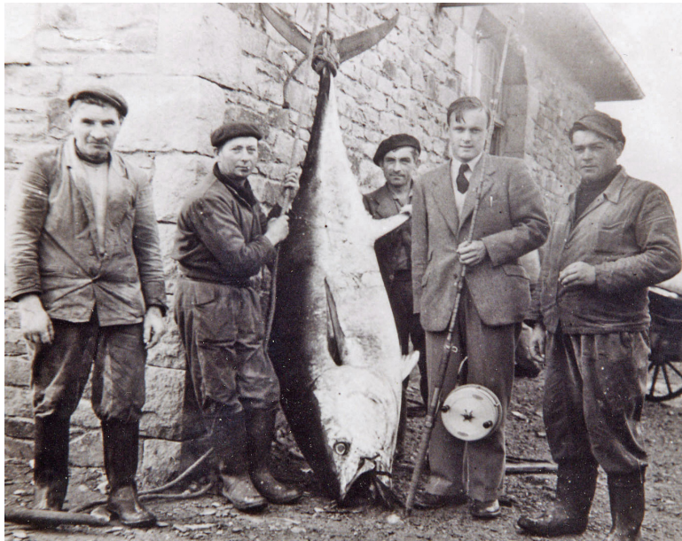
4 - Le dernier thon pris dans la baie